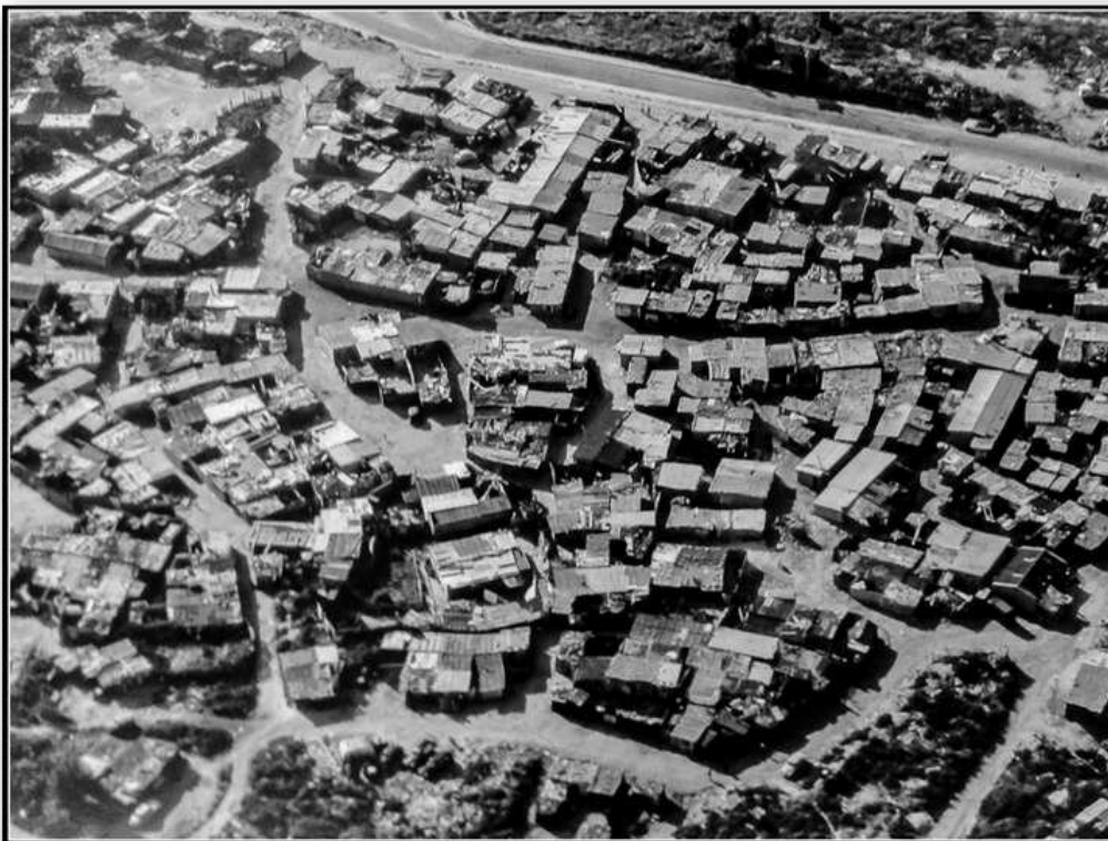
Exposition Préfecture des Hauts de Seine