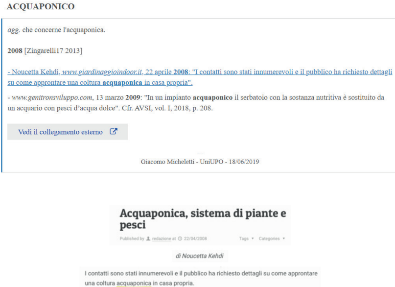
Fig. 1. Esempio di retrodatazione acquisita da AVSI e poi ricontrrollata in Google con aggiornamento a firma "Giacomo Micheletti".

Tutto ciò insomma conforta la decisione da parte di ArchiDATA di suffragare le nuove datazioni accolte dal Web con una riproduzione fotografica della fonte 6 , estendendo l'uso adottato per i materiali attinti da Google Libri e arginando così la dispersione di una documentazione per più riguardi insostituibile 7 .