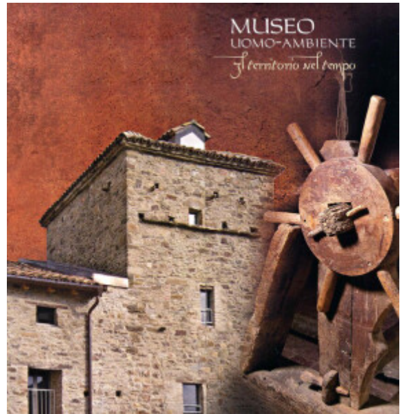
La casa torre del Museo Uomo e Ambiente

Il museo Uomo-Ambiente si trova nel piccolo paese di Bazzano, una località di collina di appena 233 abitanti situata nell'Appennino parmense presso il comune di Neviano degli Arduini. Il centro abitato di Bazzano, a 476 metri sul livello del mare, funge da perno per diverse località attigue e nuclei abitativi sparsi. La pieve di Sant'Ambrogio, edificata per la prima volta nel VI secolo e poi ricostruita nell'Alto medioevo, testimonia la centralità del paese nel corso del medioevo parmense (Mazzoli, 2002).