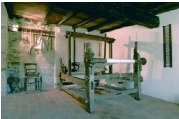
La stanza del telaio, Museo Uomo e Ambiente

Per quanto riguarda lo spazio interno, il museo è suddiviso tra il piano terra, dove si trova la stalla, e livelli successivi, dove trovano spazio altre stanze e locali. Il piano primo accoglie la stanza principale, semplice e funzionale, il cui arredamento è composto da un tavolo, qualche mobile, un camino e delle sedie. È in questa stanza che le persone vengono accolte quando arrivano in museo, dove si svolgono eventi, riunioni, presentazioni di libri e altre attività rivolte al pubblico e agli abitanti locali. La