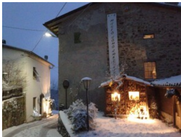
Attività dei Presepi, Museo Uomo e Ambiente

È significativo segnalare, mentre si ripercorrono le attività di azione con il paesaggio (Clement 2016) condotte a Bazzano, che nell'ultimo anno il museo è riuscito a coinvolgere scuole non solo dell'Appennino ma anche della città di Parma, riuscendo in quella difficile attività di connessione tra pianura e montagna. In questo modo il museo è arrivato anche a chi non condivide quotidianamente i suoi temi e le sue esperienze, co-progettando con le istituzioni scolastiche percorsi che intercettassero i loro bisogni, concentrando gran parte dei propri sforzi e della propria programmazione sul mondo della formazione e dell'educazione.