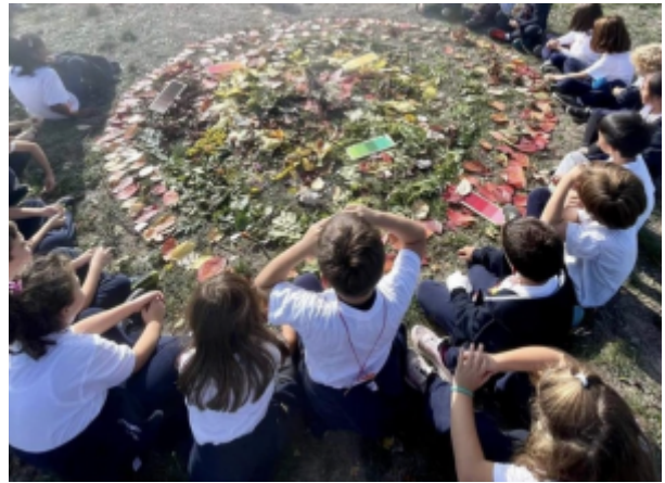
Attività all’esterno del Museo Uomo e Ambiente con oggetti ed elementi naturali raccolti

necessità di lavorare su un “fuori” nasce dal lavoro fatto con le scuole, dagli anni Ottanta in poi, relativo alle diverse storie del paese. Infatti, fin dalle sue origini l’associazione conduce delle attività finalizzate all’esplorazione, riflessione e relazione con il territorio locale (coniugando conoscenza e fruizione), ad esempio recuperando vecchi sentieri o tracciandone di nuovi, contribuendo a significare e inventare nuove o vecchie geografie del territorio.