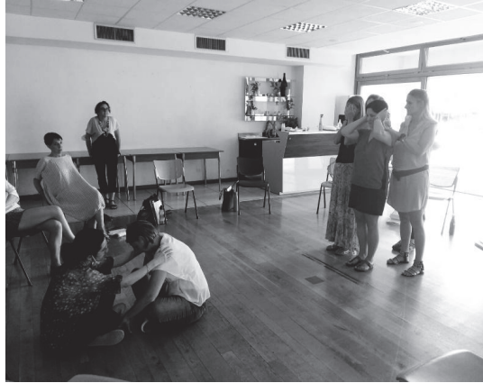
Fig. 4 – Scultura familiare

Durante la scultura familiare (fig. 4), un'osservatrice commenta: “Mi ha colpito l'uso dello spazio, due aree separate con un nucleo inamovibile”. Chi interpretava Pippi dice a posteriori: “Io stavo bene lì rannicchiata, guardavo le fughe sul pavimento e pensavo alle mie cose.”. Chi interpretava la mamma (la persona con le mani sulle orecchie) aggiunge: “Io avevo le mani di qualcuno dietro appoggiate sulla spalla. Mi sono chiesta: se tu servizio non hai più la mia spalla su cui appoggiarti cosa fai?”. A questa domanda ha fatto seguito un'altra osservatrice: “Nella scultura la possibilità di incontrare gli sguardi degli altri mi sembra chiusa.”