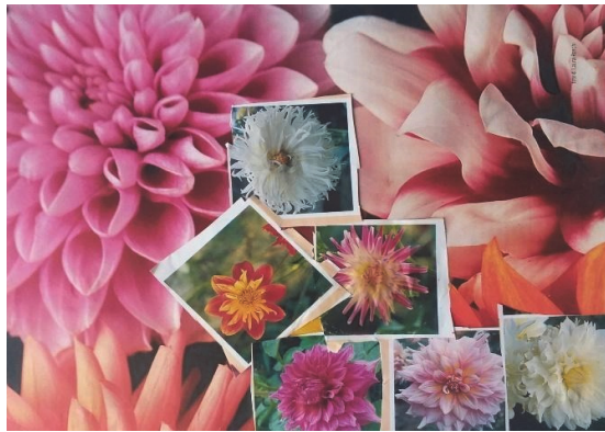
Fig. 1 – Lascia che sia: se son rose fioriranno (mood board)

Durante l'attività delle mood board sono già rilevabili alcune aperture. Una mood board (fig. 1), dal titolo "Lascia che sia: se son rose fioriranno", è accompagnata da queste parole: "Ho percepito un mood buono, libertà, come un fiore che sboccia."