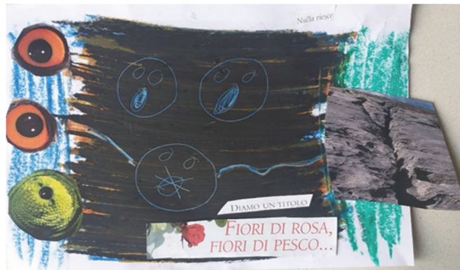
Fig. 3 – Fiori rosa, fiori di pesco (mood board)

Date queste premesse, la domanda aperta che l'equipe si pone è quella di capire in che modo intervenire e lavorare con questa famiglia [...] altamente patologica, evitando che le dinamiche faticose con la famiglia compromettano l'intervento stesso con la figlia. Quali strumenti è possibile adottare [...] l'equipe del CDD è sufficientemente competente? Quale linea tenere [...]